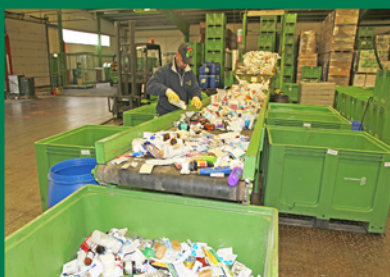
Sortierung - Tri

Beipackzettel und Verpackungen werden recycelt.