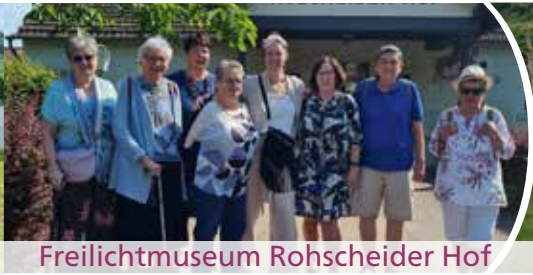
Freilichtmuseum Rohscheider Hof