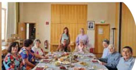
Rund um die Welt Frühstück