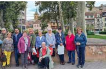
Reise ins Elsass